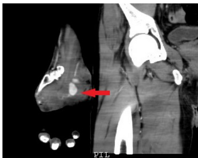
Figure 2: Angiotomografía evidenciando la dilatación de arteria cubital.