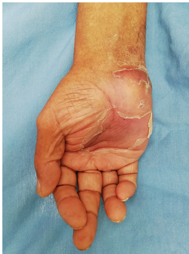
Figure 1: Zona de punción, eminencia hipotenar.